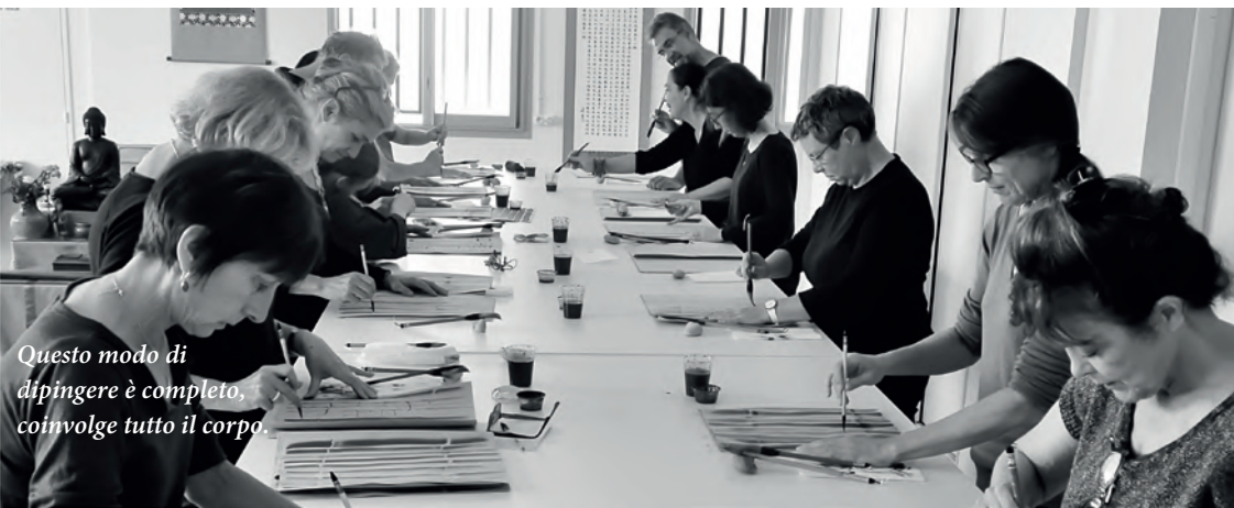
Questo modo di dipingere è completo, coinvolge tutto il corpo.

Zazen 座禪 letteralmente significa meditazione seduta. Toccare, attraverso un corretto modo di sedersi, la parte spirituale pura originaria che esiste in ciascuno di noi, spesso oscurata dai nostri pensieri e dalle tempeste emotive che ci turbano. “Se riuscirai a comprendere che lo zazen è la grande porta della legge, sarai come il drago che entra nell'acqua o la tigre che rientra nel folto della foresta.” (Maestro Dogen Zenji, XIII secolo)